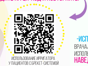
ИСПОЛЬЗОВАНИЕ ИРРИГАТОРА У ПАЦИЕНТОВ С БРЕКЕТ-СИСТЕМОЙ

-ОБЯЗАТЕЛЬНО ЕЖЕДНЕВНО ИСПОЛЬЗУЙТЕ ИРРИГАТОР. ВОЗЬМИТЕ ИРРИГАТОР, НАВЕДИТЕ НА QR-КОД И ПОВТОРЯЙТЕ!