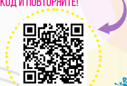
ИСПОЛЬЗОВАНИЕ ЕРШИКОВ У ПАЦИЕНТОВ С БРЕКЕТАМИ

- ИСПОЛЬЗУЙТЕ ЗУБНЫЕ ЕРШИКИ! ПОПРОСИТЕ ВАШЕГО ВРАЧА/ГИГИЕНИСТА ПОДОБРАТЬ ВАШ РАЗМЕР ЕРШИКА И ИСПОЛЬЗУЙТЕ ЕГО ЕЖЕДНЕВНО. ВОЗЬМИТЕ ЕРШИК, НАВЕДИТЕ НА QR-КОД И ПОВТОРЯЙТЕ!