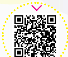
ЧИСТКА ЗУБОВ И БРЕКЕТ-СИСТЕМЫ ОРТОДОНТИЧЕСКОЙ ЩЕТКОЙ

- КАЖДЫЕ 3 МЕСЯЦА ОБЯЗАТЕЛЬНО ПРИХОДИТЕ НА ЧИСТКУ И ФТОРИРОВАНИЕ К СТОМАТОЛОГУ!