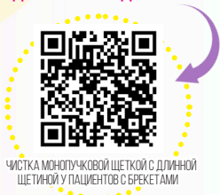
ЧИСТКА МОНОПУЧКОВОЙ ЩЕТКОЙ С ДЛИННОЙ ЩЕТИНОЙ У ПАЦИЕНТОВ С БРЕКЕТАМИ

-ВОЗЬМИТЕ МОНОПУЧКОВУЮ ЩЕТКУ, НАВЕДИТЕ НА QR-КОД И ПОВТОРЯЙТЕ!