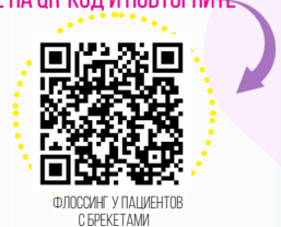
ФЛОССИНГ У ПАЦИЕНТОВ С БРЕКЕТАМИ